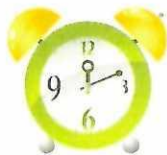
звук часового механизма